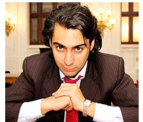
MARCO ENRÍQUEZ OMINAMI